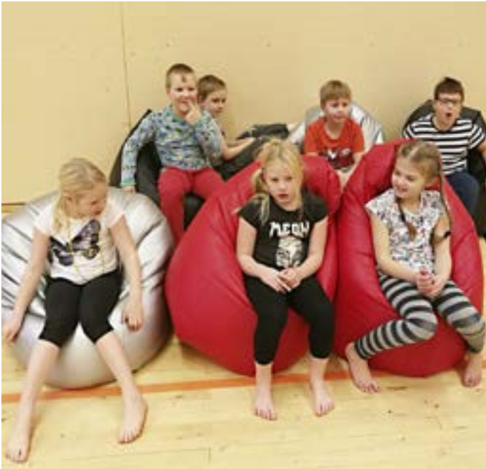
Metsämaan Metsästysseura on lahjoittanut Iltapäiväkerholle säkki- tuoleja. Säkkituolissa on mukava istua, levätä ja ne myös inspiroivat leikkeihin. Riemukkaat kiitokset Metsästysseuralle Iltarilaisilta!